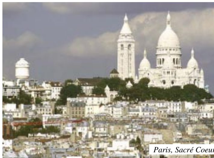
Paris, Sacré Coeur