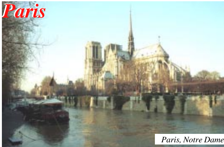
Paris, Notre Dame